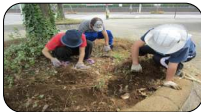
美しが丘花壇の整備の様子