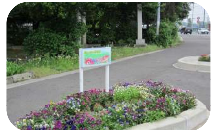
佐川野の交差点は色とりどりの花が咲いています。