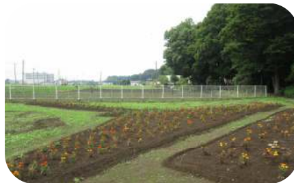
マリーゴールドを沢山移植しました。