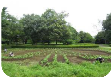
ゆーらんど花壇の様子

野木町との契約によるゆーらんど花壇の整備、佐川野地区交差点の花壇整備をボランティアで行っています。きれいな花がたくさん咲いていますので、ぜひ散歩してみてください。