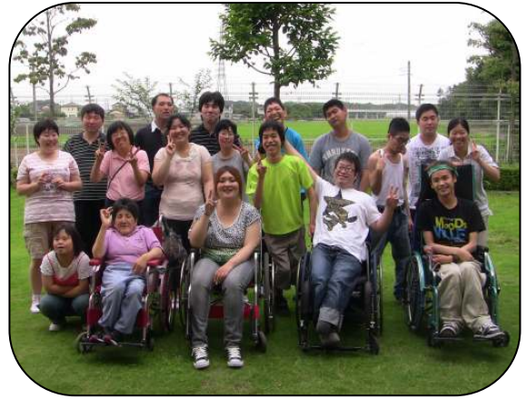
おしゃれ自慢が集まりました