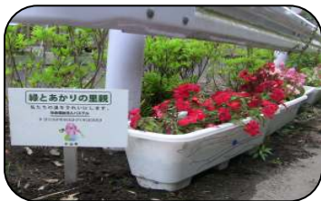
パステルの前の道路です。看板に気づきましたか？