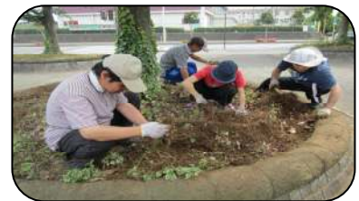
「ごくろう様！」と声をかけていただくと、元気が出るつるたみの皆さん！

野木町との契約によるゆーらんど花壇の整備、佐川野地区交差点の花壇整備をボランティアで行っています。きれいな花がたくさん咲いていますので、ぜひ散歩してみてください。