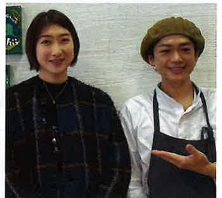
競泳の池江璃花子選手(左)ともSNSを通して交流が始まった。同じ境遇である母親同士も連絡を取り合う仲になっているそう