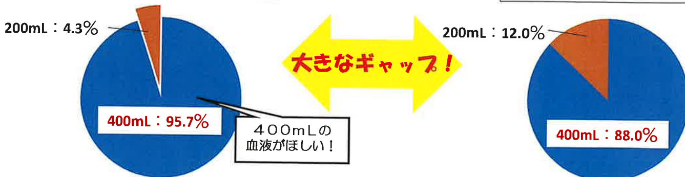
栃木県内の献血者の協力状況